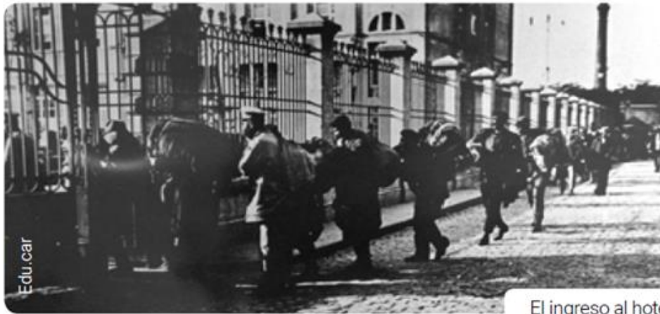
El ingreso al hotel