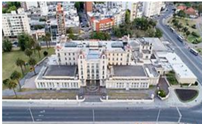
El Edificio Mercosur, la sede del bloque (en Montevideo)

El MERCOSUR se basa en una Carta Democrática, que no permite la pertenencia al bloque de países no democráticos, establece una zona de libre comercio y acuerdos de arancel común, así como diversos mecanismos de complementación productiva y de integración económica, social y cultural, incluyendo la libre circulación de los ciudadanos del bloque. Los idiomas oficiales del MERCOSUR son el español, el portugués y el guaraní.