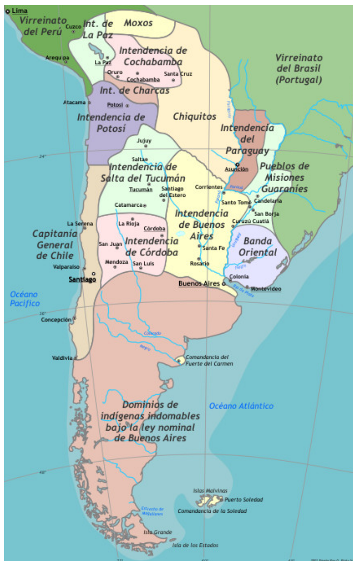
Virreinato del Río de la Plata 1776-1810

Existió un Territorio Nacional que no se constituyó en provincia: Los Andes (ver mapa) . Este era un pequeño territorio en la Puna de Atacama que se formó en 1900 a partir de una disputa limítrofe que incluía a Bolivia y a Chile. Su capital era San Antonio de los Cobres (Actualmente localizada en la provincia de Salta). A pesar de contar con recursos mineros