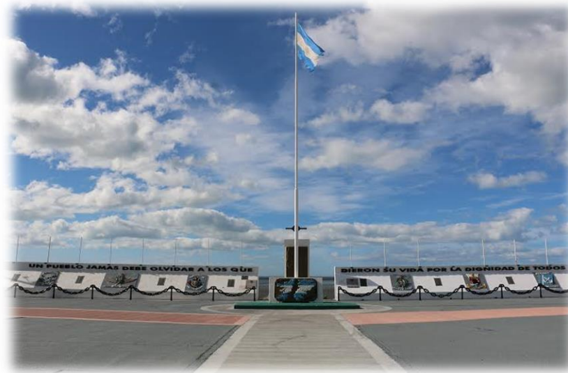
Reserva Costa Atlántica - Monumento Héroes de Malvinas

Ubicado en Río grande - Tierra del fuego. Argentina