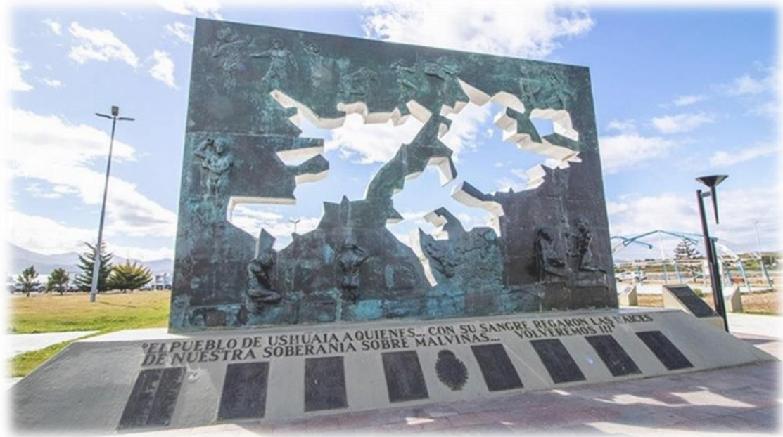
Monumento ubicado en plaza Islas Malvinas, Ushuaia - Tierra del Fuego. Argentina.