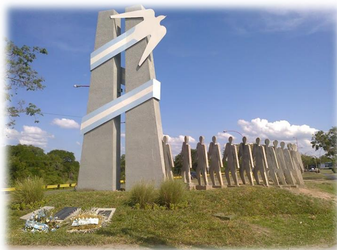
Monumento a los caídos en Malvinas, ubicado en Resistencia – Chaco, Argentina.