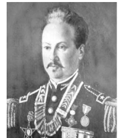
Tte. Cnel. Luis Jorge Fontana 1879 - 1881