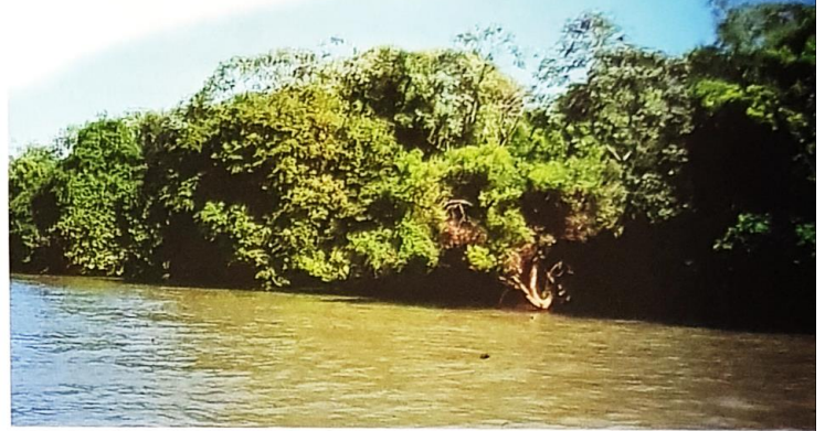
Los guaraníes vivían en zonas selváticas ubicadas a orillas de los ríos Paraná y Paraguay.

Los matacos usaban esta bolsa o yika para recolectar, transportar y almacenar granos y semillas.