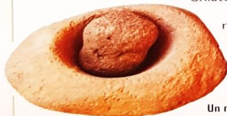
Un mortero utilizado por los diaguitas para moler granos.

jefaturas. Cargos dirigentes hereditarios que se ejercían sobre un conjunto de comunidades o aldeas de una región.