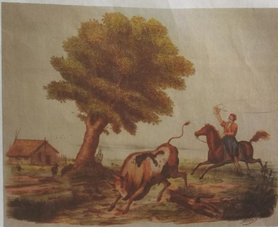
En la vestimenta cotidiana del gaucho se destacaban los lazos de cuero, el poncho y las boleadoras, de tradición indígena, que utilizaban con gran habilidad para la caza y como armas de defensa. Gaucho enlazando un vacuno , acuarela de Alberto Isola.

El Litoral ha sido considerado como un bloque regional integrado por las actuales provincias de Santa Fe, Entre Ríos y Corrientes, en el que a pesar de las diferencias, existían elementos económicos en común. La actividad principal era la ganadería bovina, vinculada al comercio exterior. Se exportaban sobre todo cueros y otros productos ganaderos. Los hacendados y los comerciantes de estas zonas no estaban de acuerdo con que Buenos Aires fuera el único puerto. Exigían la libre navegación de los ríos Paraná y Uruguay, con el objeto de que llegaran hasta sus costas las naves extranjeras sin pagar impuestos a la aduana de Buenos Aires. Demandaban también la apertura de nuevos puertos para comerciar directamente con el extranjero, obtener productos más baratos y vender rápidamente sus producciones.