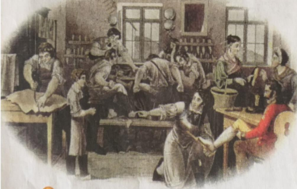
Fábrica de calzados londinense, imagen de 1815. La emancipación significaba para los nacientes estados americanos que podían relacionarse libremente con el resto del mundo. Inglaterra, gran potencia naval y con la industria más desarrollada del momento, fue el país que pudo obtener mayores beneficios en el comercio con América. Sus representantes comerciales se asentaron en las principales ciudades del continente. Según lo que han leído sobre las industrias inglesas, ¿qué ventajas tenían estos productos sobre los del Interior?