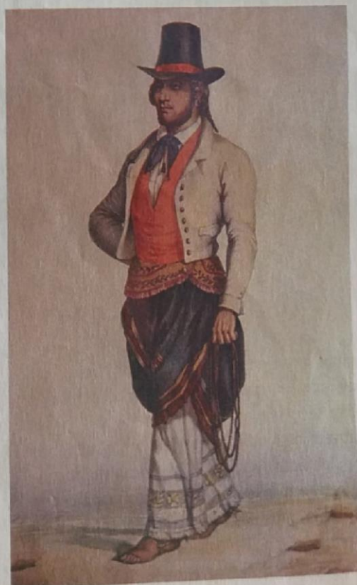
Los propietarios de grandes superficies de tierras comenzaron a convertirse en caudillos regionales. Estanciero porteño , litografía de D'Hastrel.