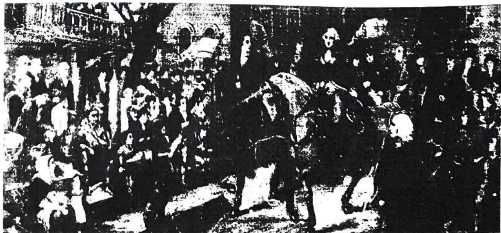
George Washington fue, además de un líder en la guerra de la Independencia de los EE. UU., uno de los impulsores de la Constitución de ese país.