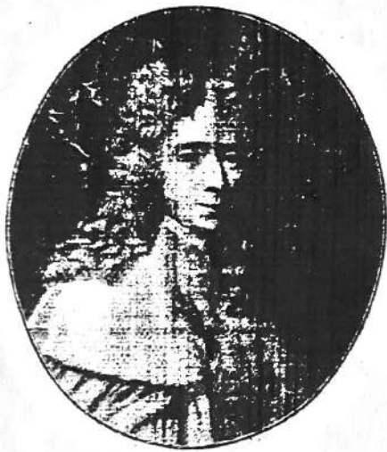
Retrato de Montesquieu, el autor de El espíritu de las leyes .

Sobre la base de estos modelos, otros países dictaron sus propias constituciones, incluidos los que se formaron en América después de haber declarado su independencia.