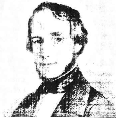
Juan Bautista Alberdi, pensador político argentino, cuyas ideas fueron fundamentales para la organización nacional.

La Primera parte incluye principios generales y los derechos de los habitantes, además de los mecanismos legales que garantizan que esos derechos sean respetados. La Segunda parte se refiere al Gobierno federal, o gobierno de toda la Nación, organizado en tres poderes: el Legislativo, el Ejecutivo y el Judicial. También, de acuerdo con el sistema federal, la Constitución sienta las bases para la organización de los gobiernos provinciales.