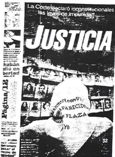
Portada del diario Página/12 , con la declaración de inconstitucionalidad de las leyes de Punto final y Obediencia debida.

La Corte Suprema de Justicia de la Nación declaró la inconstitucionalidad de las leyes de Obediencia debida y Punto final. Estas leyes habían traído como consecuencia que muchos de los juicios por hechos ilegales cometidos durante la dictadura militar quedaran sin efecto. Posteriormente, una ley del Congreso, la n.º 25.779, las declaró nulas. En otra oportunidad, el tribunal de Casación Penal declaró inconstitucional el artículo 80 inciso 7 del Código Penal en relación con niños, niñas y adolescentes porque consideró que no cumple con la Convención Internacional sobre los Derechos del Niño.