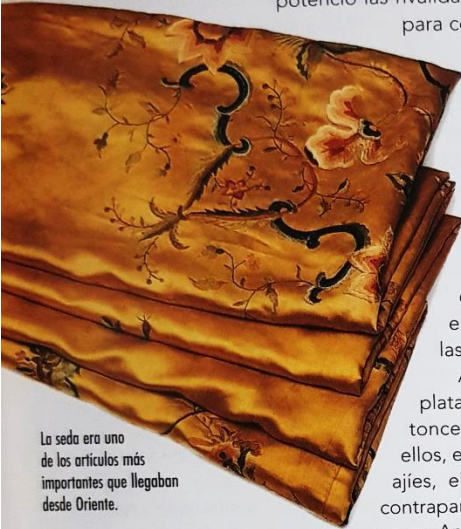
La seda era uno de los artículos más importantes que llegaban desde Oriente.

© Santillana S.A. Prohibida su fotocopia. Ley 11.723