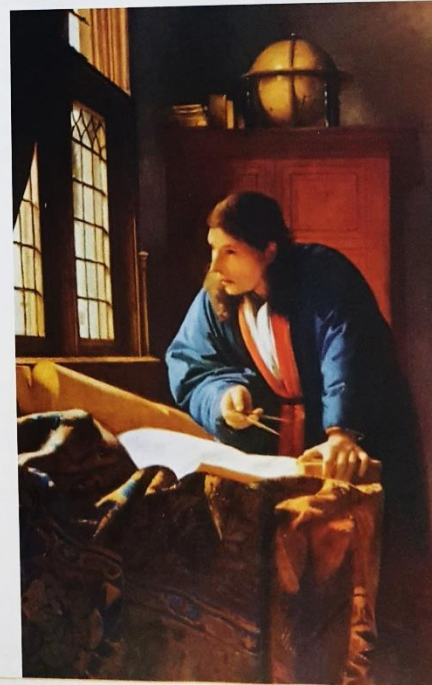
Gracias a la información que aportaron los marinos que participaron de los viajes de exploración, los cartógrafos del siglo xvi pudieron trazar mapas más precisos que los de sus antecesores.

Sustancia natural o muy poco transformada necesaria para obtener los productos que elabora una industria determinada.