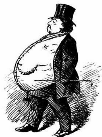
La diferencia entre trabajo y capital.