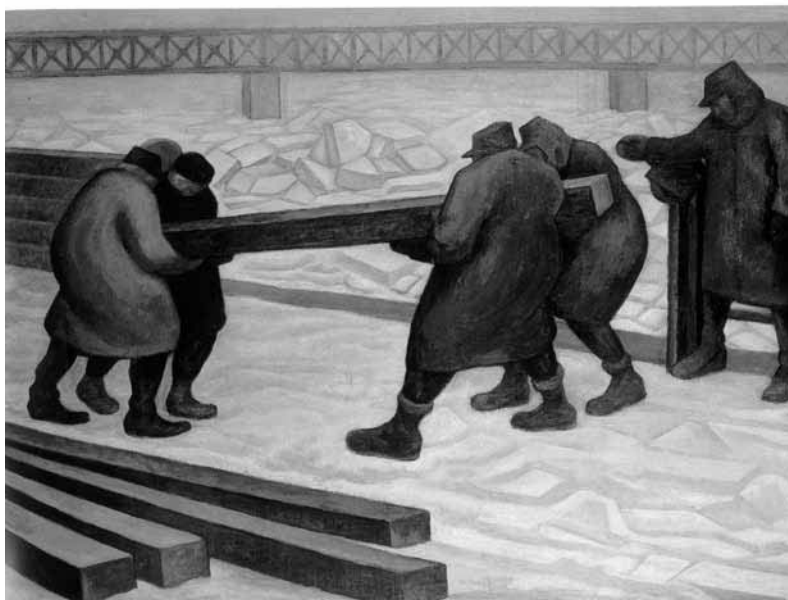
Conteniendo el hielo del Danubio en Bratislava, Diego Rivera, 1956.