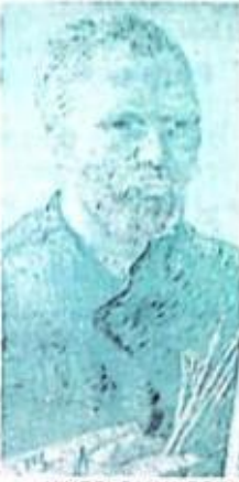
VINCENT VAN GOGH