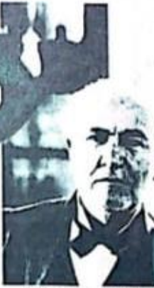
THOMAS A. EDISON

tenía suficiente con dos horas diarias de sueño. Van Gogh sólo podía conciliar el sueño si había rociado la cama con alcanfor, y Dickens si el lecho estaba orientado hacia el Norte.