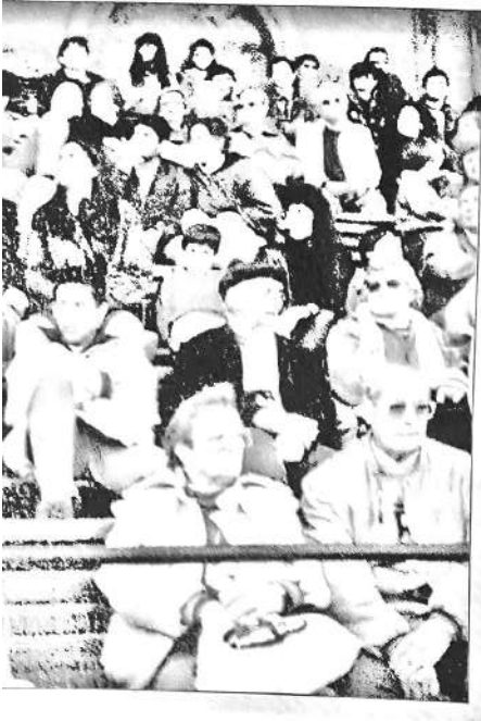
Asistentes a un espectáculo no forman un grupo, aunque sus objetivos individuales coincidan.

Cuando se trabaja en grupos para llevar adelante una tarea pedagógica o terapéutica, se necesita aplicar técnicas grupales . Algunas de estas técnicas son: el seminario, la mesa redonda, la discusión en grupos pequeños, el