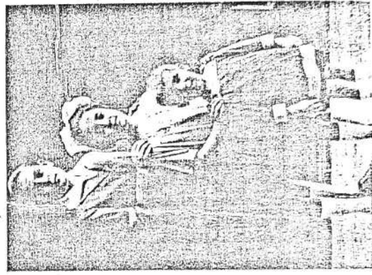
Tres hermanos, fotografiados en 1922. La familia es el primer grupo que integramos desde que nacemos.

Los grupos primarios o pequeños grupos, están compuestos por un número