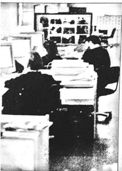
Los empleados de una empresa forman un grupo secundario, entre los miembros de trabajo se pueden establecer relaciones afectivas que generan grupos primarios.