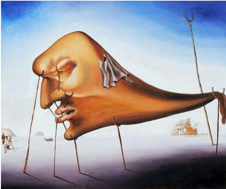
Autor: Salvador Dalí Título: El sueño Año: 1937

La obra posee figura compleja y fondo simple