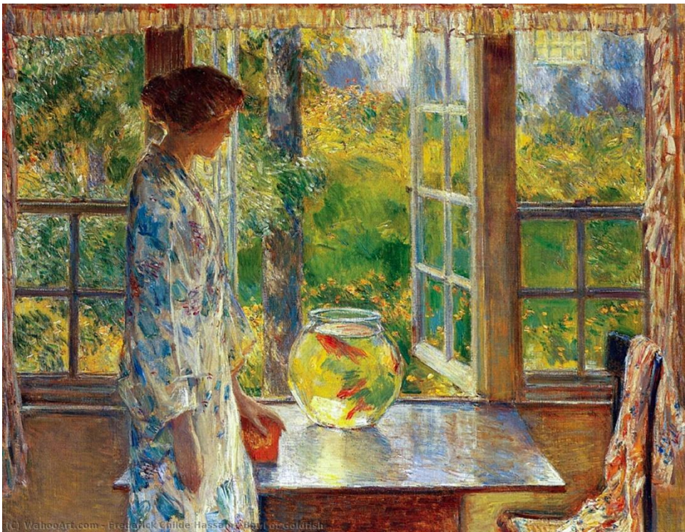
Autor: Frederick Childe Hassam Título: Tazón de Goldfish Año: 1912

La obra posee figura compleja y fondo simple