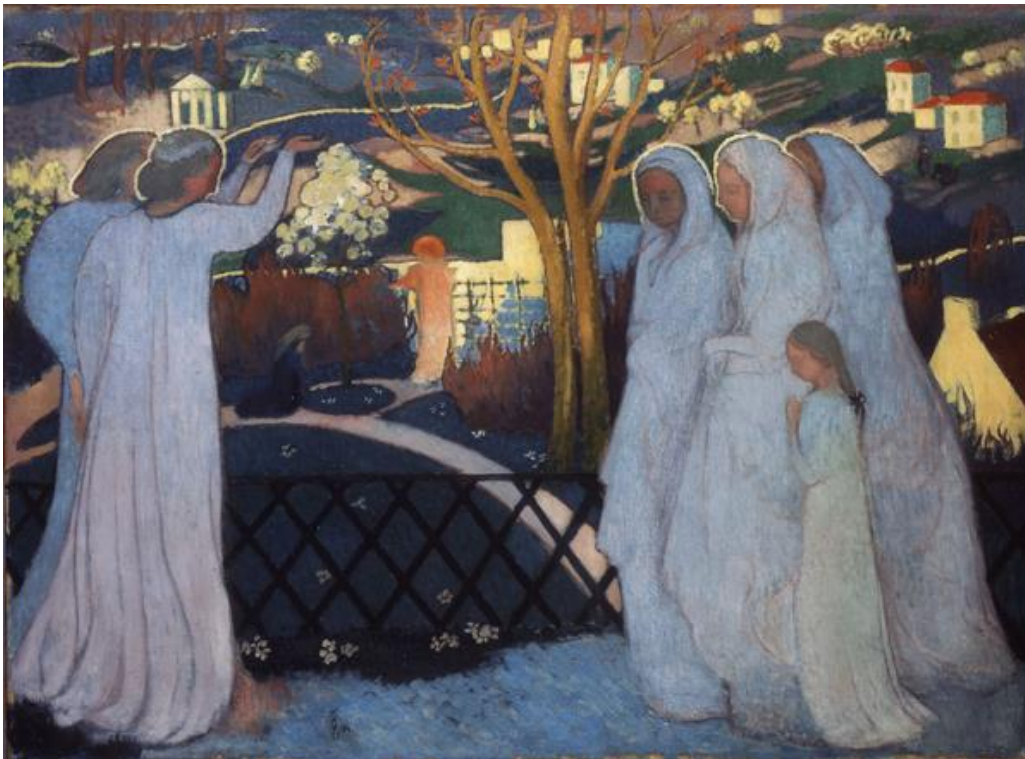
Autor: Maurice Denis

La obra posee figura simple y fondo simple