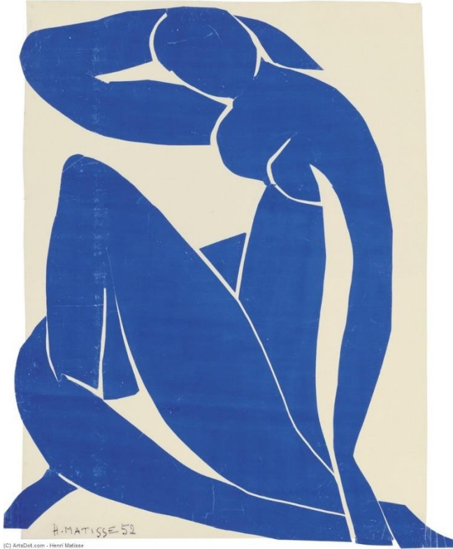
Autor: Henri Matisse Título: Desnudo Azul Año: 1952

La obra posee figura simple y fondo simple