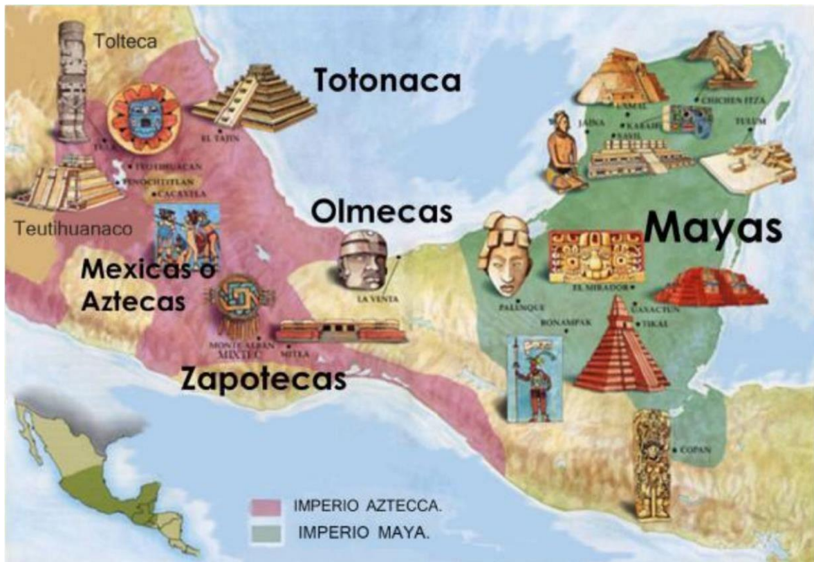
Mapa político-cultural de Mesoamérica