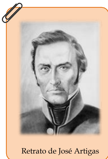
Retrato de José Artigas

Por último ¿Qué sucedió con la Banda Oriental? La Banda Oriental estaba representada, espacialmente, por el actual territorio uruguayo. Allí también se inició un proceso independentista liderado por José Gervasio Artigas. Alrededor de 1811, la Junta de Gobierno porteña apoyó a Artigas, iniciando la expedición que se conoció como el “sitio de Montevideo”. Sin embargo, la Junta de Gobierno terminó firmando un armisticio con los realistas de la Banda Oriental. Artigas se negó a aceptar esta resolución y se trasladó junto a sus tropas a la actual Provincia de Entre Ríos (evento conocido como “éxodo oriental”). Desde allí comenzó una lucha tanto contra la Junta de Gobierno porteña como contra los realistas que se habían instalado en