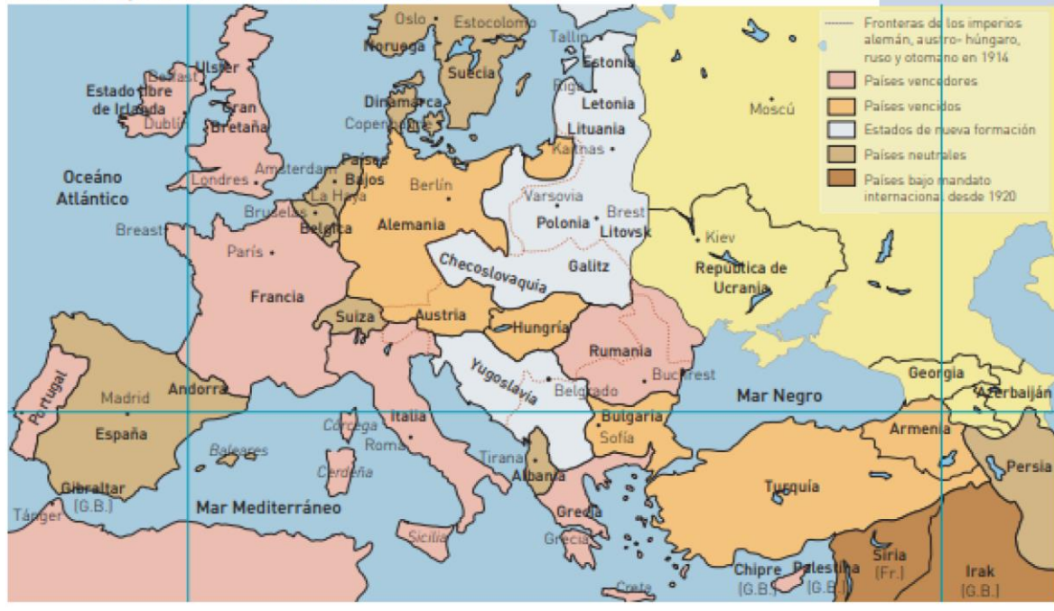
El mundo después de la Primera Guerra Mundial

Como consecuencia de los tratados de paz, se formaron nuevos países con los territorios de los Imperios que fueron derrotados en la guerra: el Imperio Alemán, Austro-Húngaro y Turco. El Imperio Ruso también desapareció, pero por una revolución socialista que se produjo en 1917. En el Medio Oriente: Inglaterra y Francia se repartieron las posesiones del derrotado Imperio Turco. En Palestina, el gobierno inglés se había comprometido a establecer “una patria nacional” para el pueblo judío. Esta es una de las principales causas del conflicto actual entre palestinos e israelíes.