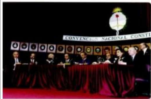
Convención Nacional Constituyente de 1994.

Es un régimen federal porque las provincias son unidades autónomas, con su propia organización político-administrativa, que han delegado parte de sus atribuciones en un nivel federal como por ejemplo: la defensa del territorio, y el desarrollo nacional.