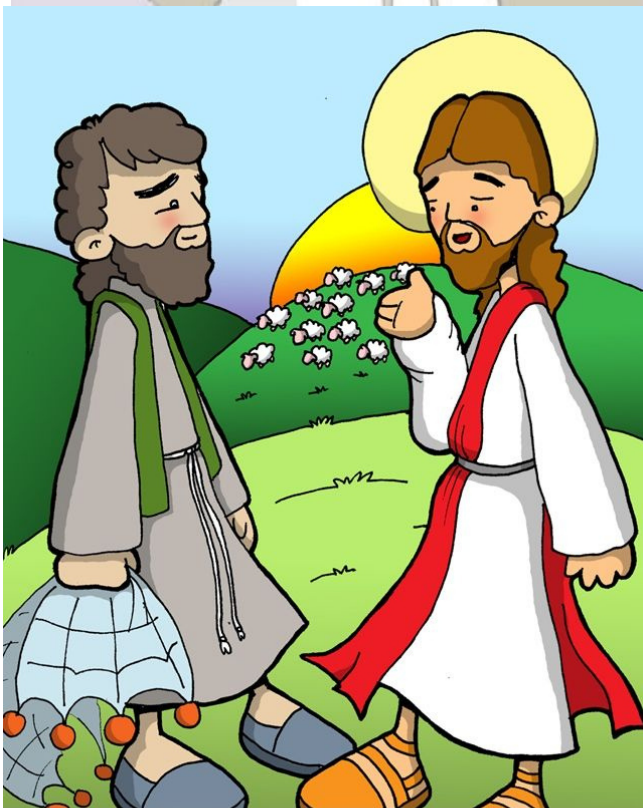
11° ESTACIÓN: JESÚS CONFIRMA A PEDRO EN EL AMOR