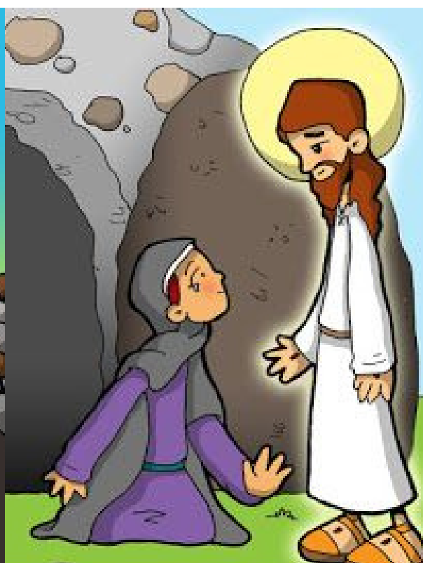
2° ESTACIÓN: JESÚS SE APARECE A MAGDALENA