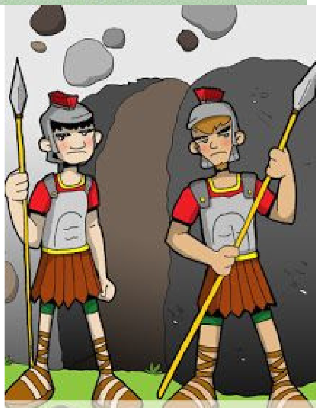
4° ESTACIÓN: LOS SOLDADOS VIGILAN EL SEPULCRO VACÍO