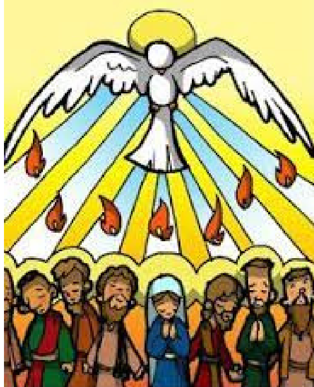
14° ESTACIÓN: PENTECOSTÉS