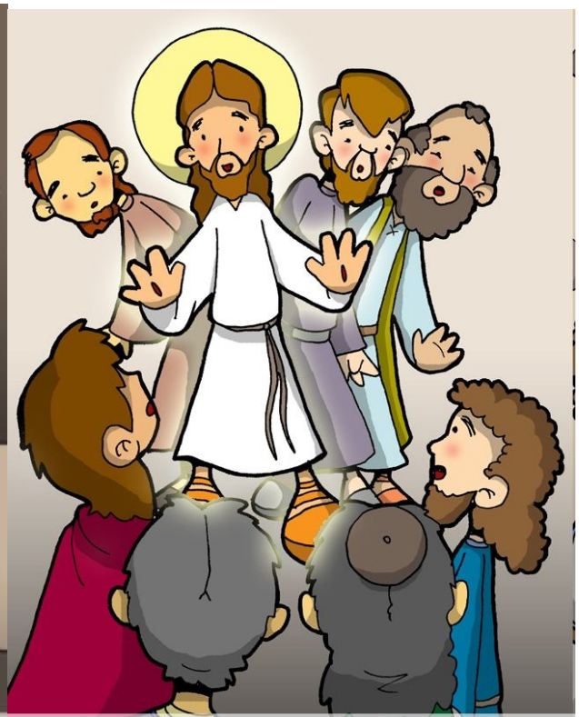
5° ESTACIÓN: PEDRO Y JUAN 6° ESTACIÓN: JESÚS MUESTRA LLEGAN AL SEPULCRO VACÍO SUS LLAGAS EN EL CENÁCULO