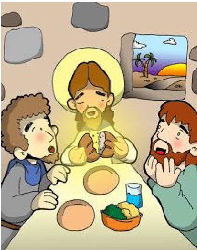
7° ESTACIÓN: EL CAMINO A EMAÚS