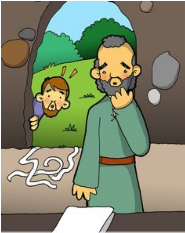
5° ESTACIÓN: PEDRO Y JUAN 6° ESTACIÓN: JESÚS MUESTRA LLEGAN AL SEPULCRO VACÍO SUS LLAGAS EN EL CENÁCULO