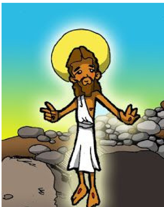
1° ESTACIÓN: JESÚS RESUCITADO