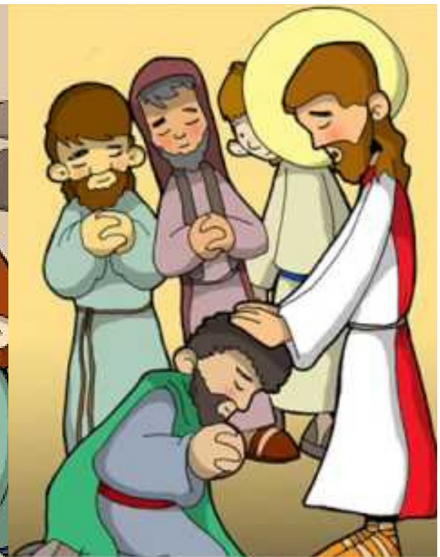
8° ESTACIÓN: JESÚS DA A LOS APOSTOLES EL PODER DE PERDONAR LOS PECADOS