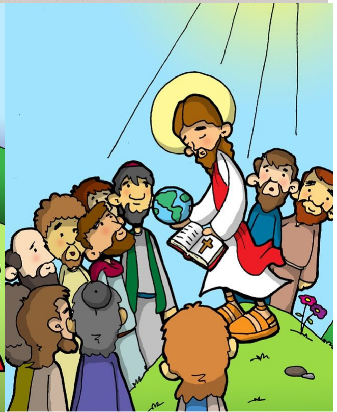
12° ESTACIÓN: JESÚS DEJA LA MISIÓN DE EVANGELIZAR