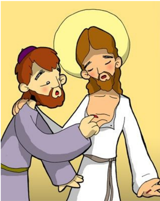
9° ESTACIÓN: JESÚS FORTALECE LA FE DE TOMÁS