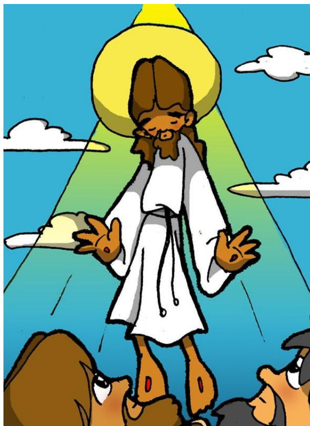
13° ESTACIÓN: JESÚS ASCIENDE A LOS CIELOS